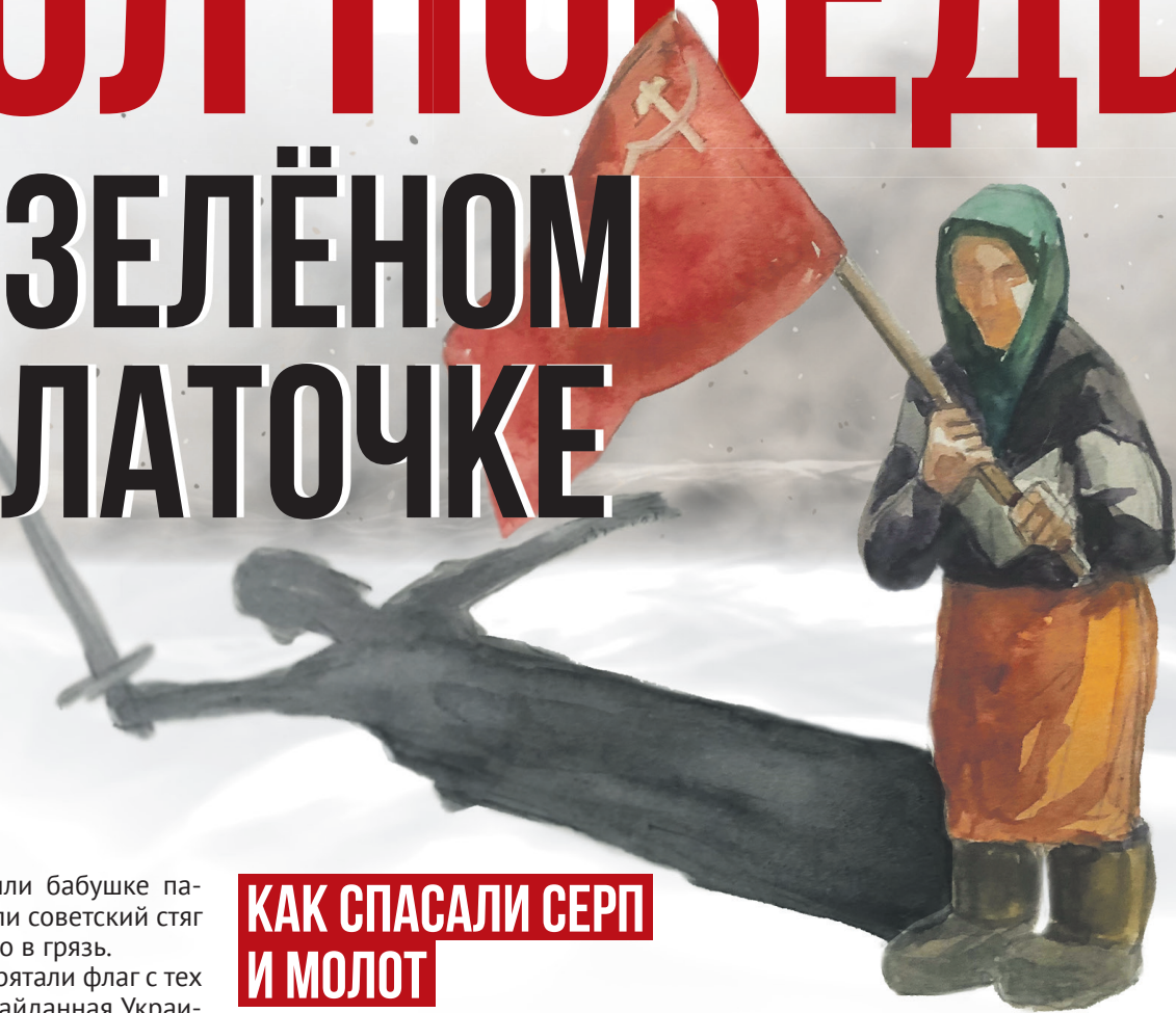
Рисунок Елены Рябоваловой, коллаж Алексей Беленёв