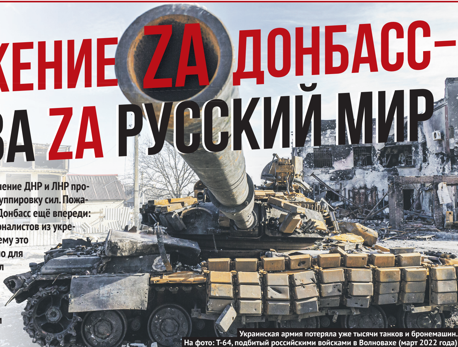
Украинская армия потеряла уже тысячи танков и бронемашин. На фото: Т-64, подбитый российскими войсками в Волновухе (март 2022 года)