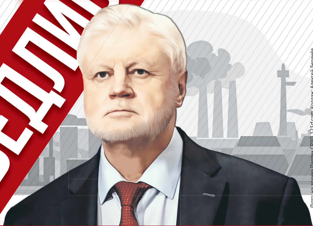
Фото: из архива Партии СРЗП, 123rf.com. Коллаж: Алексей Беленёв.

Как именно Северная Осетия – Алания может преодолеть последствия санкций?