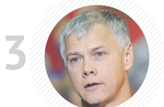
3 Комитет ГД по защите конкуренции ВАЛЕРИЙ ГАРТУНГ