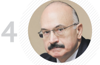
4 Комитет ГД по науке и высшему образованию СЕРГЕЙ КАБЫШЕВ