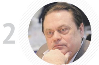
2 Комитет ГД по делам национальностей ГЕННАДИЙ СЕМИГИН