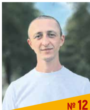
Дзасохов Артур Романович