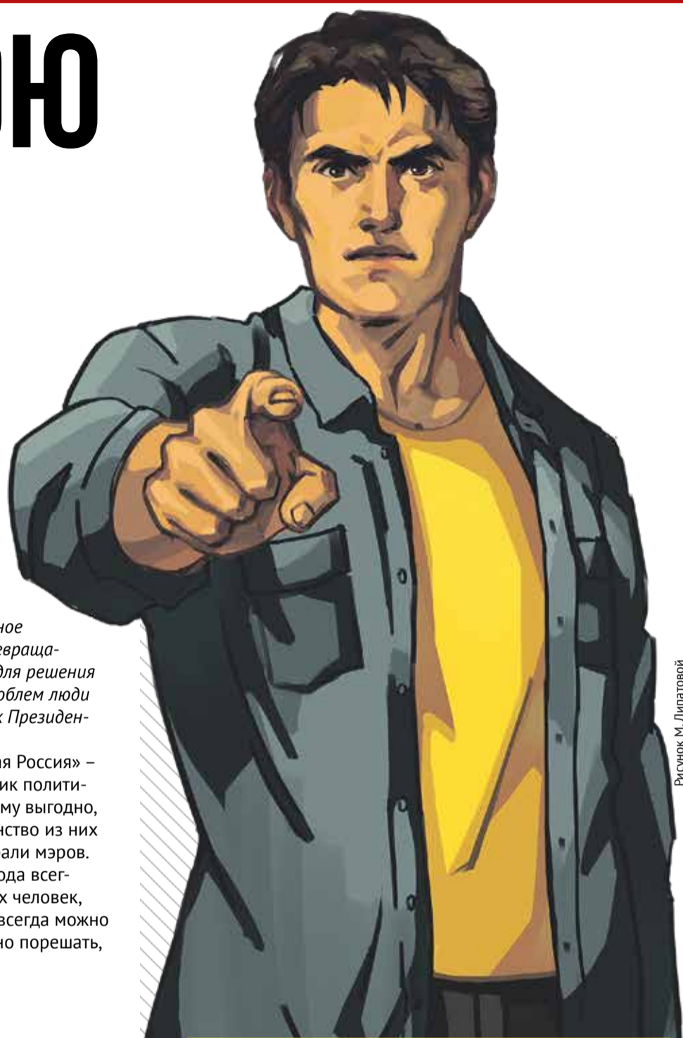
Рисунок М. Липатовой

Но надежда есть! Есть еще в России города, в которых удается отстоять право граждан выбирать мэров напрямую. И происходит это обычно благодаря СПРАВЕДЛИВОЙ РОССИИ – ЗА ПРАВДУ . Так, совсем недавно в Амурском районе Хабаровского края принципиальная позиция справедливороссов сохранила жителям право голоса. Социалисты проголосовали против законопроекта об отмене прямых выборов, и единороссам не удалось его протолкнуть.